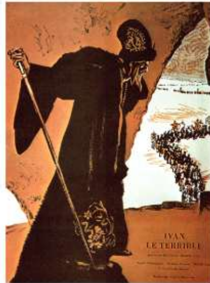
Афиша кинофильма «Иван Грозный» (1-я серия) С. М. Эйзенштейна в зарубежном прокате

Опираясь на резко возросшее у советских людей чувство гордости за свою страну, И. В. Сталин инициировал развер-